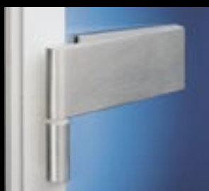
Studio Classic – wszędzie tam, gdzie cenione są proste linie