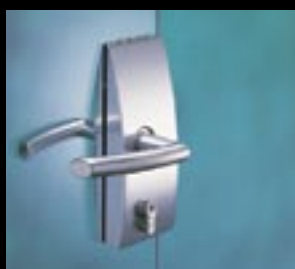
Zamek ARCOS z klamką bez rozetki