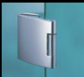
Zawiasa ARCOS Office – zaprojektowana zgodnie z elegancką linią