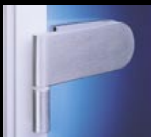
Studio Rondo – stylowo zaokrąglone kształty