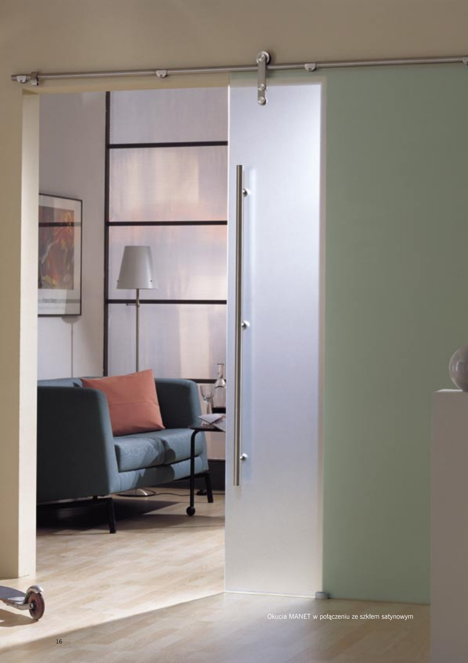
Okucia MANET w połączeniu ze szkłem satynowym