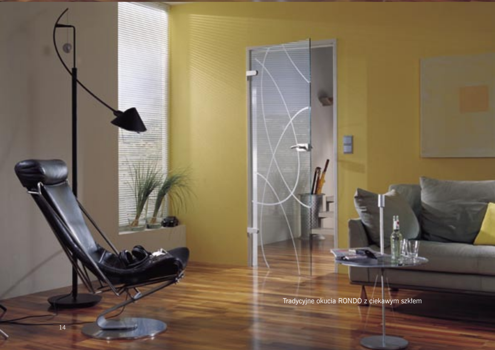
Tradycyjne okucia RONDO z ciekawym szkłem