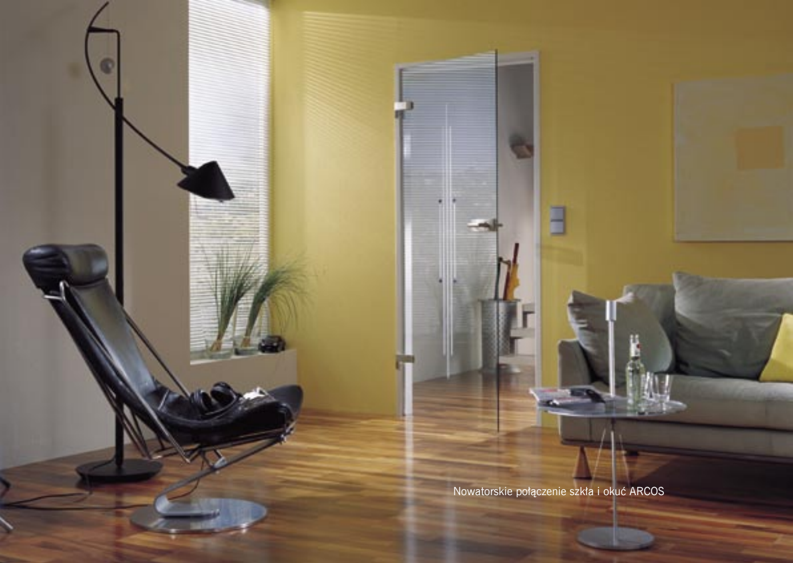
Nowatorskie połączenie szkła i okuć ARCOS